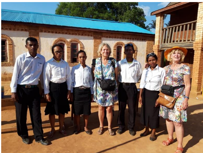
Op de foto met de leerkrachten van Sadabe, 2019

In elk dorp betalen we het schoolgeld voor de tien armste gezinnen. De selectie vindt plaats door het oudercomité in overleg met de onderwijzers. Daar waar een deel van het schoolgeld in natura wordt betaald betalen wij de helft van de waarde van de rijst.